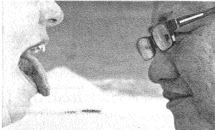
Die Zunge verrät einiges über den Körper und mögliche Erkrankungen: Bestimmte Areale sind inneren Organen zugeordnet.